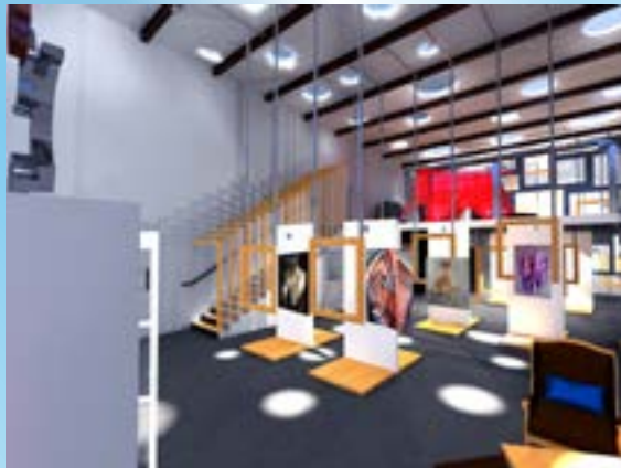
Réalisation d'un Musée

80 euros/heure, remboursés en cas d'étude du projet