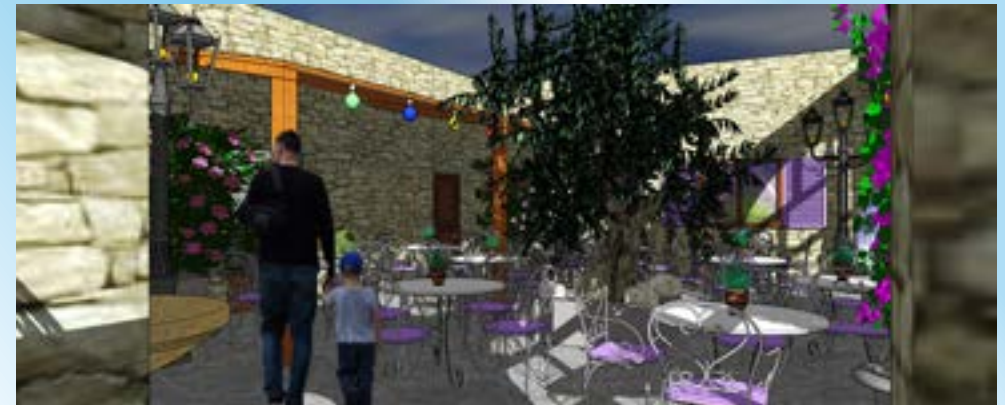
Réalisation d'un coffee shop en Chine